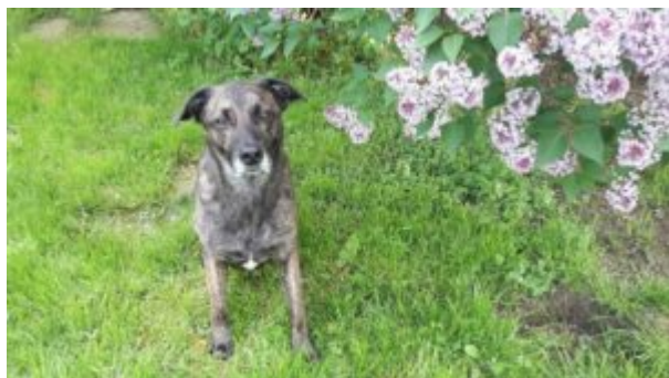
Troldík bojem o život zdrchaný

Jeho psychika, ač vypadá jako kusanec psa (28 kg), je jemná jak pavoučí síť. Je to labil, o jeho bubákách z horkovzdušných balónů, které generalizoval i na vítr jsem už psala, stejně tak mu stačila jedna nepříjemná zkušenost, když vedle něj spadla poklička na dlaždičky. Lekl se a od té doby nemá rád ani rachtání při mytí nádobí, zvuk vařících se brambor v hrnci. Když to tak sepisuji, musím se usmívat, jaký to je pako. ☐ Ale přitom je to skvělý zvíře, který funguje venku na myšlenku, člověk vůbec nemusí zvýšit hlas nebo ho kárat. V něčem je ideální. No nic, prostě se mu na veterině událo všechno špatný dohromady. Velká bolest, výměna střechy na klinice (spousta rachotu), cinkání různých misek v hospitalizační místnosti, neustálé proudění různých lidí (sestřičky, doktoři), nemožnost úniku. Jiné zvíře by to zvládlo určitě psychicky lépe. Já každopádně nepochybuji, že Trolda měl tu nej péči, v úterý jsme jeli na kontrolu a vytáhnout kanylu a vrhnul se do náruče paní doktorce, která o něj o víkendu pečovala. To on příliš často nedělá.