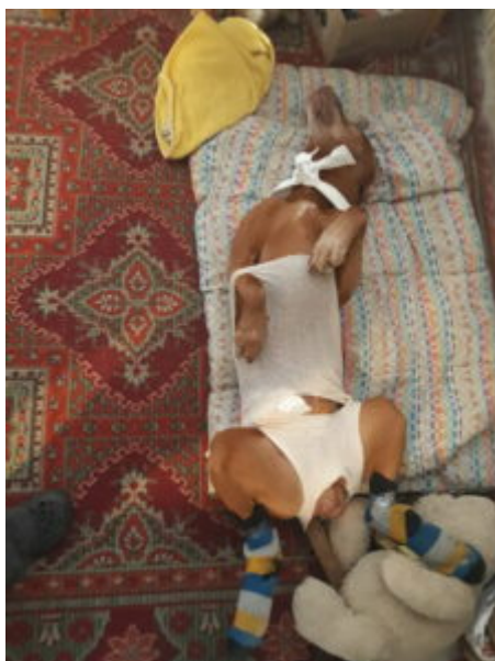
v pyžamu, ponožkách a hlavně s medvídkem

samotnou, pozor, to nee! - abych setřela zbytek oholených chloupků. Páč ty samy o sobě na kůži svědí a vyvolávají tak potřebu drbání. A drbání je to poslední, co bychom chtěli. To je fakt vynikající rada, tou se řídíme vždy, když máme pesu po operaci. Večer už projevoval zájem o nějaký to jídlo, tak dostal připravené mleté kachní masíčko asi ve třech dávkách a pak se i dožadoval venčení, protože ho ta narkóza trošku prohnala. Ale nic velkého. A pak už se šlo spát. Ještě před usnutím, jsem ho ale zase musela kolíbat na klíně, jak mimino. Pak vytuhnul zcela prkenně.