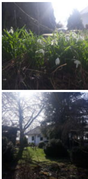
Krásnej jarní den na chalupě

A ještě jsem v sobě našla sílu, vydloubnout si ze záhonků nějakýho toho “aplégra” , kterýho převezu do novýho. Třeba právě dcerunku tý krásný sněžný čemeřice, kterou jsme pak po návratu zasadila do svýho dočasnýho záhonku u Domečku. Spolu s denivkama třebas, který se mi taky podařilo ještě ze země v rychlosti vydloubnout.