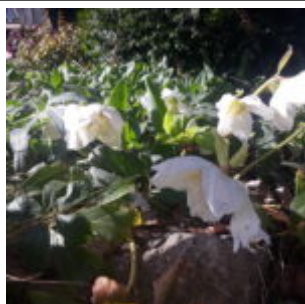
Moje krásná čemeřice bílá