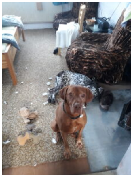
Hele paničko - vona Tali vybuchla! Já to neudělal!