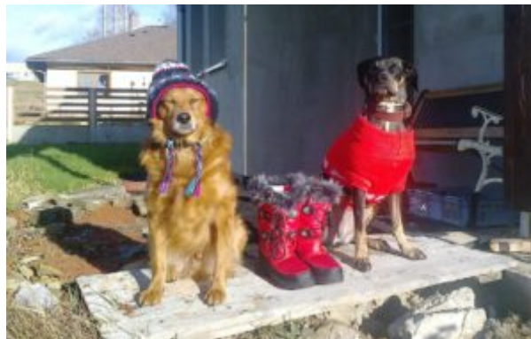
Kora a Goliášek v čase vánočním