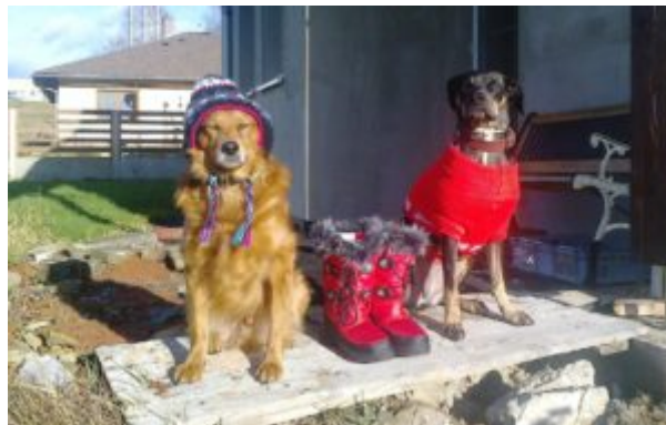
Kora a Goliášek v čase vánočním

ešivá by neposlala Goliáška s jeho předvánoční nadílkou. Fotky se nepodařilo vložit do čtenářského fóra, tak jsem navrhla, aby to Kimi poslala mě, že to tam dám. No a krom Goliáška s myškou mi Kimi poslala i jedno foto vánočkový, tak jsme se dohodly, že ho vyhodím rovnou sem, mezi články, ať se taky můžete pokochat. Stejně nic nemáte na práci, krom pečení cukroví, zdobení cukroví, shánění či balení či odesílání dárků, cídění domácnosti, vaření vaječňáku , zapalování svíček a purpury, takže se flákáte skorem, že jo ☹ a tak se ešče trochu víc vánočkově naladte ☹ :