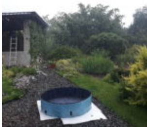
Napouštíme Rumíčkově bazének