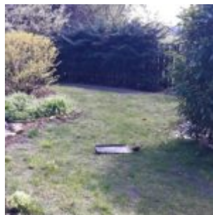
Tak copa to máme na jídeláku?