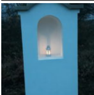
Moooc sluší, moc!