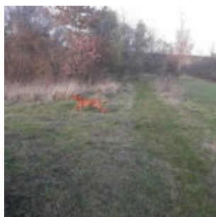
Táááklenc řežu zatáčky!

Cestou sme potkali holčičku s maminkou a tak sem jim vokázal, jak vypadá zajíček a jak se správně přechází přes silnici. Maminka pravila holčičce, že ji asi bude muset taky takhle vycvičit, aby pěkně poslouchala. Znovu sme se pak potkali u tý paní, co měla schovanej ten dárek-co byl ale pro pánika. Tak sem trochu dělal kašpara, aby se holčička nenudila, enemže to mi pánčička zatrhla a pravila, že mám ležet a nehejbat se, dokud to nevyřídí. HmMMM, trapný jako. A pak bylo ešče trapnější, jak sme se vlekli dom. Vona totiž pánčička moc nepřemejšlí, takže vobjednala něco velkýho a těžkýho a tetkon měla co dělat, aby to dopravila dom. Navíc do kopce. A navíc!! Kolem psího krámku!! Tooo sem tam tak moc potřeboval jít! Ešče tam svíteli. Je hodná pánčička, takže i když se jí moc nechtělo, tak to převláčela přes silnici a šli jsme tam. Já uuuuutiiikááál a pak sem stepoval před krámkem a moc sem se těšil, jak si nakoupim. Enemže..... smůla. Vyšla pani a řekla nám, že má zavřeno už. To sem byl teda ale velesmutnej a pak sem se vleknul domů skorem jako ta pánčička. Doma sme byli hned-tzn. asi za dvě hodiny, páč postup byl velmi pomalej, vzhledem k velikosti a váze tělesa. □ Usalašil sem se na pelíšek a spokojen, jak sem si to nakonec užil, sem čekal na věču.