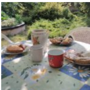
takhle si snídáme