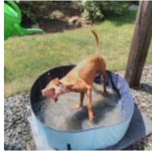
Napouštění bazénku a... Rumíčka ☐