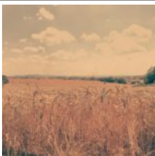
takhle obrazově Dennyky fotí krajinu