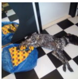
Fleky se vylily z tašky na podlahu...

Bohužel, příroda a její zákony jsou neúprosný, takže preclík nakonec boj prohrál a se zoufalým výrazem se vylil z tašky na podlahu.