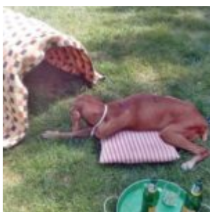
To jsem ještě spíš ležela než chodila

Hmm no. Zkoušel být sám někdy v klidu?? To je hrozná věc teda. Zvlášť, když jste vižla. A je jedno kolik vám je, protože jste zvyklý být aktivista. Jo, já si ráda poležím třeba na sluníčku a tak, ale odsud-pocud. Ale pravda, tentokrát mi samo tělo řeklo, ať nedělám blbiny. Byla jsem nešťastná.