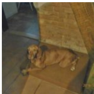
Už nejsem smutná tříkolka

Byla jsem úplně hyn a nemohla se koncentrovat. Jak já byla ráda, že něco dělám, že jen nehniju. Pánčička mi taky přidala masáže takové různé, ale to musím říct, že ne všechno se mi líbilo, spíš ne, než jo. Záda převážně ano, protože to mi uvolňovalo namožené svaly, ale taky někdy ne. Radši jsem pak odešla.