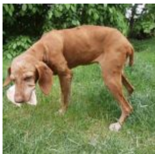
Spokojená čtyřkolka se láduje vepřovým uchem na klouby.

A jáá to uťapala!! Byl připraven mě případně donést domů, ale nemusel, nemusel. Lidi já si to tak užívala. A zas byl svět o další kus veselejší. A pánčička pochopitelně taky. Pak jsme taky vyjeli na výlet. Zase vláčkem, ale tentokrát mě tam radši naložili. Trochu potupný teda, ale co naděláme, že jo, sichr, je sichr. A tak jsem si tak střídavě ťapala, střídavě trochu kulhala, když byla nožička unavená, ale nebyla to už žádná trága.