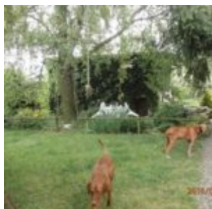
Už zase na všech čtyřech

Jenže pánčička je drbna. Měla z toho prostě tak velkou radost, že umím ty schody chodit, že to jednoho dne nevydržela (ale zase na druhou stranu to vydržela poměrně dlouho, to je fakt) a se smíchem vyprávěla páníkoj, jak jsme to na něj ušily. Páník pravil, že jsme příšery. A stejně se mnou chodil ráno dál. Mám výhodu proti Štoudvi, heč! No a krom schodů ale, já už dneska ujdu i naši oblíbenou Unhošťskou vycházku - AP, která u nás byla návštěvou, může potvrdit! Pěkně celých osm kilásků, čtyři tam, čtyři zpátky, pěkně s pobytem v hospůdce.