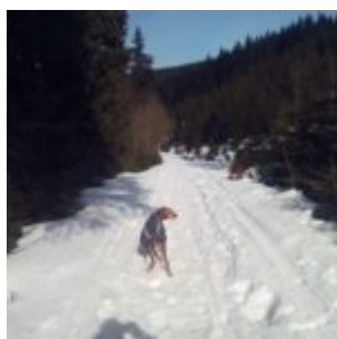
To jsem byla za tůristku v Krkonoších

Prooootože - kolik najdete pejskůch ve věku čtrnácte let, který naběhají za pět dní v horách velkohorách krkonošských nějakých těch sedmdesát kilometrů?? A to ještě kilometrů lidský, páč těch psích je mnohem víc. No? Mnoho jich asi nebude, že ne? A to ještě byl na horách sníh, takže v tom se trošku hůř běhá. To mně ale nic nevdí, já jsem aktivistka, takže jsem si vždycky pěkně poběhala a pak jsem si nacpala pupík a užívala si pohodlíčka penzionového pokojíku.