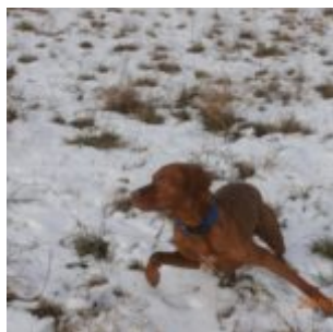
Rumoušek: Zaaa balonkéém!!!

A proto taky, jak napadne sníh, jsem celej v pozoru. Což znamená, že urputně pozoruju pánčičky nohy, jestli a hlavně KDY začne ten sníh vykopávat a rozkopávat, abych mohl hopikat. V tu dobu, pravda, neudělám normální krok. Protože nejdřív hopikám nedočkavostí, kdy, kdy, kdy??? Kdy už se bude vykopávat a pak musím skákat do vzduchu a ten sníh chytat. Fuška, řeknu vám. Pokud nejste blecha, je to dost namáhavý, tudleten pohyb prostorem.