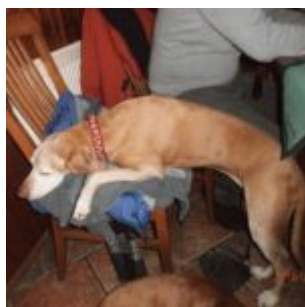
Takhle spí jen pomatená vižla... aneb unavený Ajšadlo

Ajšadlo: Měli jste si nakrást, jako já, heč. Chce se mi trochu spát, nejlíp někde na měkkým... tady by to šlo.