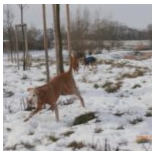
Ajša, Rumištajn a Bubi: vižlo vítací víření

Štajnidlo: Ty jo to jsou zas mudrosloví, jdu radši koukat z okna, ešivá nejde Ajšadlo! A de!! Už de!! Půjde se ven!!