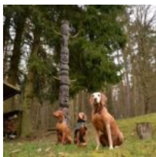
Zátiší s vizslami a totemem

Prostě se „probourala“ a šla to řešit po svém. Štoudev, který si s vajíčkem nevěděl rady, prostě od vajíčka odstrčila a... nasměrovala ho k tomu svému. A to už jsem jí do toho nemluvila, jen jsem v němém úžasu koukala na to, jak moudře to zařídila. Mrňousovi nechala své, už načnuté vajíčko, aby snadno zjistil, že uvnitř je něco, k čemu se musí dostat a že už to má rozpracované, aby měl ten start pro poprvé trošku jednodušší. A pustila se do toho jeho, nenačnutého. Jakmile s ním byla hotova, což při jejím přístupu trvá tak asi pikosekundu, stála a v klidu koukala, jak Štoudev „bojuje“ s vejcem. Jak si pomlaskává, jak ho dostává ven z obalu.