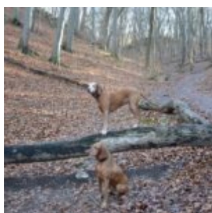
Maďarské vizsly, Bubi v popředí

Před časem tu vyšel článek, který mi připomněl to, jak málo svým zvířecím přátelům rozumíme. Některé prvky komunikace jsou nám známy, popsány, ví o nich široká veřejnost. Ale jsou i momenty chování, kdy prostě nemáte šanci zavčas vědět, poznat, odhadnout.