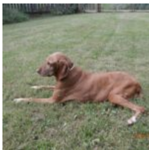
Bubi ještě v pohodě, léto

Nebylo mě už zapotřebí. Domluvily jsme se s paní veterinářkou, která se ptala, zda nechci rovnou kastrovat, že tohle pouze v případě, kdyby něco nebylo v pořádku. Nechtěla jsem Bubi přidělovat další potíže, další velké hojení. Taky jsem věděla, že by se měla chystat hárat (a taky ano) a že orgány budou prokrvené. Což by mohl být problém. Takže pokud by vše bylo v pořádku, rozhodně nekastrovat.