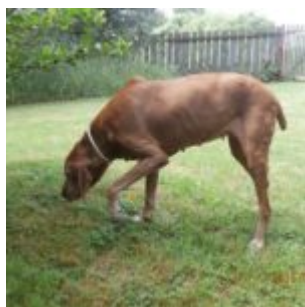
Bubi ještě v pořádku, léto

Torze! Bylo okamžitě to, co mě napadlo. Druhá polovina se snažila mě uklidnit, ať nejančím, že se prostě zase nahltala a má jen nafouklý břicho. To mohlo být, ale... měla jsem tušení, že nebude. Potíž je v tom, že Bubi je taková - no, neforemná :-)) a navíc má hodně povolené to břicho a vždycky, když se nají, tak se jí viditelně zvětší. No jo, ale... i tak jako divně dýchala... šestý smysl velel: „Dělej!“ Na druhou stranu nechcete blbnout na kvadrát. Zvlášť takhle večer, když je tma a do auta je nutno dojít kus cesty.