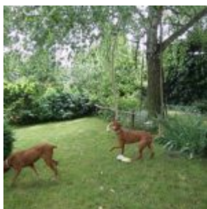
Bubi a Štajn v létě