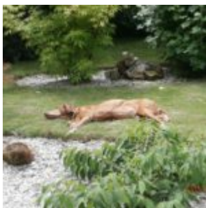
Bubi v létě