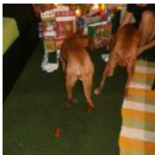
Štajn a Bubi o Vánocích

Vlítli jsme tam - hlavně teda já. Bubi je hodná, věděla, že to je pro mě poprvní, tak nechala tu první radost jen pro mě a sama se upozadila. No teda jako takhle, vona se upozadila hlavně k tý míse s dobrotama, páč jako obložená mísa prej je jako ta košile, a balíčky jako ten kabát, říkala. Prostě prej bližší košile než kabát. Já jsem hravej, moc hravej, takže jsem to tam celý rozpohyboval. Balíčkyy, balíčky, cupování, trhání mašlí. Tjo, kdybyste viděli, co všechno tam bylo!!