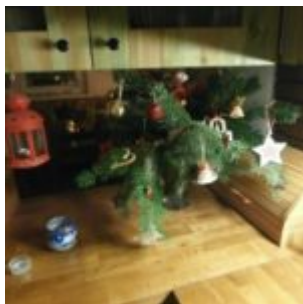
Vánoční výzdoba u BubiŠtajnů

Nejdřív ovšem prej bylo třeba vyšňořit byt, takže to u nás začlo svítit, občas hořet, vonět po skořici, občas po spálené purpuře. To podle toho, jak se pánčičce dařilo, či nedařilo rozvonět či rozhořet purpuru či jiné voňavostě.