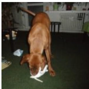
Štajn s dárečkem

Lítal jsem tam tu s krysou, tu jsem mával házedlem. Občas jsem zaasistoval při rozbalování jinech balíčkůch. Prostě pod sosnou bylo dosti živoučko. Pak najednou ani nevím, co se stalo a... bezvědomí. Vzbudili mě až na venčení.