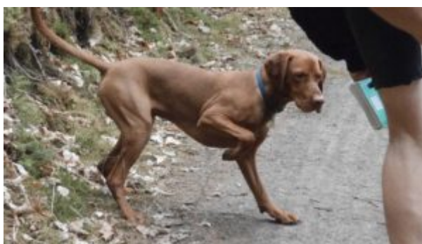
Štajn číhající na to, kam poletí vykopnutá šiška

K čemu jsou všechny tyhle venkovní hry dobré? No nejen k tomu, aby se pes vyblbnul a zabavil. Takhle zcela nenápadně psa učíte, že s vámi, s vámi je furt legrace a že pes nikdy neví, co přijde a je tedy dobré být pořád ve střehu a držet se vás. Neutíkat a mít vás pořád v merku. Protože by mohl propásnout nějakou srandu a po ní taky odměnu (to hlavně zpočátku, kdy se pes hru učí).