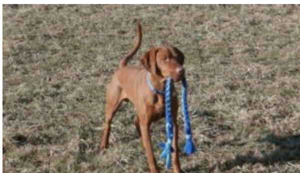
Štajnidlo a jeho oblíbené přetahovadlo/házedlo

Vidím to na svém životním dárku jménem Bubice. Jak vždy uvítá, když jdeme spustit nějakou naši společnou hru. Hra - kouzelný a mocný to prostředek k tomu, abychom lépe pronikli do psího světa. A hrát můžeme kdekoliv a kdykoliv a hlavně cokoliv. Od jednoduchých her bez pravidel, jako je třeba přetahovaná, až po hry složitější, jako je na bombaře, stopaře, kdy už se musíme oba učit.