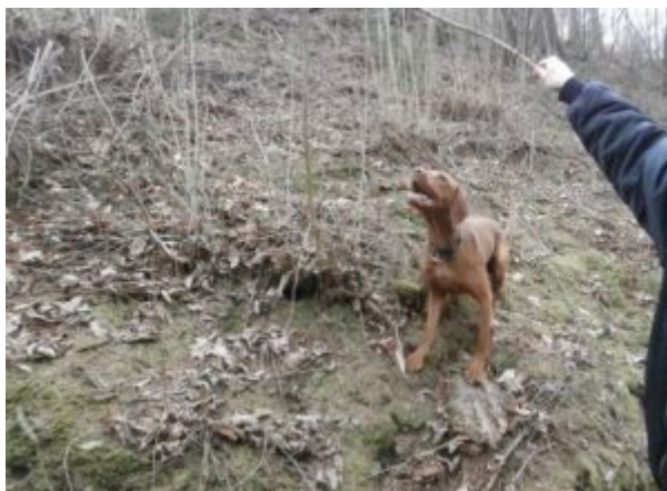
Hrátky s proutkem

Další hra, kterou jde hrát venku a nic k tomu nepotřebujeme, je „ hra na babu “. Když je pes vzdálen, zavoláme buď nějaké heslo, které si pro tuhle hru zvolíme - klidně i formou specifického hvízdnutí nebo třeba i jen jméno (mně se osvědčilo heslo, protože pes ví, co bude následovat, a otočí to na pětíku a pádí, aby si mě ulovil). Buď můžu mít v ruce hračku - např. přetahovadlo, do kterého se po doběhnutí zakousne, a nebo může mít povoleno „ulovit“ mě.