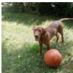
Štajn fotbalista 2

A taky to trénujeme trošínek u pejskůch jinejch. Učí mě pánčička, že si mám prvně dřepkins a pak teprv můžu utíkat se kámošit. Což mě ale teda jako neba. Stejně jako mě neba, že si mám dřepkins, když vidím ptáčky. Co je tohle za divný postupy? Já to vidim jasně: vidim ptáčka - ztuhnu - zacílím - zaměřim a už ho беру! Naprosto přirozený, ne? Zvlášť, když si ze mě ještě hodlá dělat bžundu a hopkat po plotě.