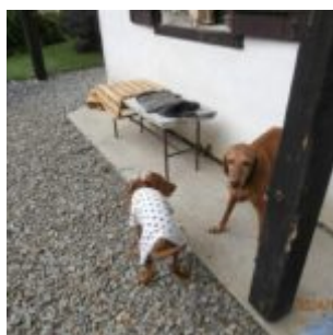
Štajnidlo v nedbalkách

U nás za barákem jsem potkal kámoše. A byla řežba největší. Zuby lítaly, chlupy lítaly, fšecek lítalo. Jen pánčička stála, trochu již zničena, a tiše to sledovala. A doufala, že až přijdu domů, tak tam už konečně vypnu. Tak jako doufat může, co by ne. Zajímavý je, že jí to zpravidla nevyjde. A tetkon taky moc ne.