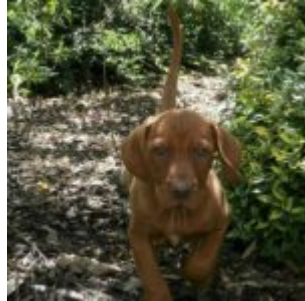
Na zahradě

Bojuju vůbec moc rád. Od prvního okamžiku. Jsem Bojovník Nebojsa, nebojím se ničeho, všechno mě zajímá, Motalová říká, že pud sebezáchovy jaksí nula. Vždycky při tom setře ten pot z čela, prej z těch představ, co na ni čeká. Náhodou ale!! Ať tak moc nekecá, já jsem samostatná jednotka, to uznávám, ale... zase na druhou stranu už jsem i objevil kouzlo toho, že s nima je dost dobrá zábava. Takže když se voni dostatečně snažej, sem já taky snaživej.