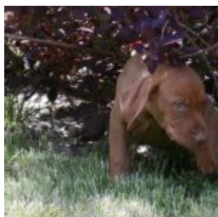
Šibalské oko, archiv Petra K.

Jo. A jedna důležitá věc. Než jsem sem přišel, dozvěděl jsem se, že je hrozně důležitý nosit tady misky prej. Tak jsem to vočíhnul a jo, Bubiška nosí misku. Tak já taky. Ale páč mám na většinu věcí svůj vlastní osobitý názor, nebudu jako blbeček nosit tu prázdnou, to je k ničemu, vezmu vždycky tu plnou. Tam co je voda. Hele a to máte vidět ten hukot. Jak to najednou začne všechno žít a rozpohybuje se to.