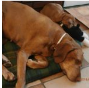
Spíme