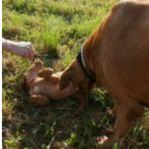
Představuji se Bubišce, foto Petra K.

Prozatím jsem měl ale jiný starostě. Motalové se dali do pohybu a já jsem v té trávě tak úplně neměl přehled, tak jsem se radši vydal za nima. Motalka byla nadšená, že se za nima řítím. Motal se mi smál (a smát se zatím teda nepřestal, ale... vono všeho do času jako, on ho ten smích ještě přejde!) . Popadli mě do náručí a šli jsme zase domů, tam jsem si zaběhnul vyplašit kánata a oběhnout výběh pro lišáky. Překontroloval jsem zásoby v garáži a pak mě najednou zase popadli a šoupli mě do té plechárny, co jsme šli prve kolem ní.